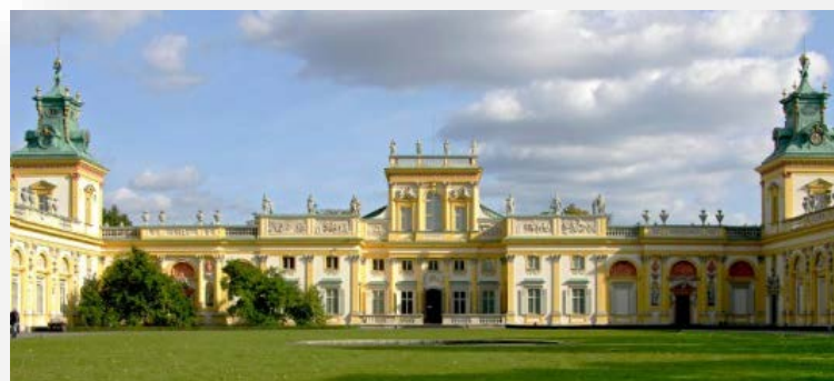
Palais de Wilanow