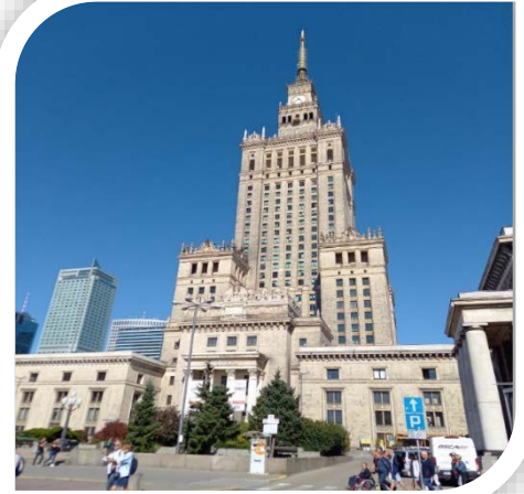
Palais de sciences

Lundi 5 : Varsovie, le matin, visite du palais de sciences (1955), plus haut gratte-ciel de la capitale (237m), cadeau « discutable » de la nation frère soviétique que la nouvelle Pologne a fini par conserver avec un très beau panorama du sommet sur la ville. Puis musée de l'histoire des juifs polonais et du ghetto. Après déjeuner, le parc Lazienki avec l'émouvant monument dédié à Frédéric Chopin et flânerie vers le Palais sur l'eau.