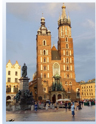
Cathédrale de Cracovie

Dimanche 11 : Cracovie, ce fut la seule journée pluvieuse du voyage qui gâcha un peu la visite de l'ancienne capitale polonaise. Le matin, quartier juif avec visite d'une synagogue et exposition de Cracovie sous l'Occupation dans l'ancienne usine de Schindler (dont fut tiré le film). Après déjeuner, colline du Wawel avec la cathédrale et le château royal (nécropole des rois polonais), enfin, retour place du marché et basilique Notre-Dame. Le soir, restaurant juif avec musique klezmer.