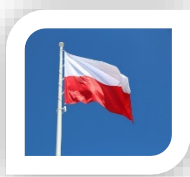
Drapeau de la Pologne