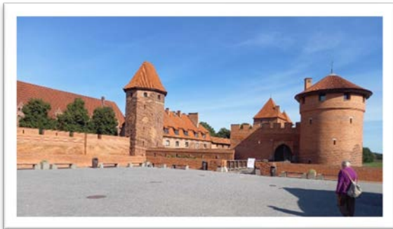
Château des Chevaliers Teutoniques

Jeudi 8 : Départ vers Malbork et l'immense château, siège du Grand Maître de l'ordre des Chevaliers Teutoniques. Déjeuner et route vers Torun : promenade en ville, visite de la maison natale de Nicolas Copernic et la fameuse tour penchée (il n'y en a pas qu'à Pise). Pour les gourmets, dégustation de pain d'épices.