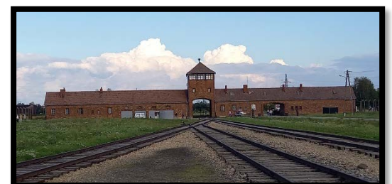
Entrée du camp de Birkenau

Route vers Oswiecim (Auschwitz-Birkenau), même si l'on s'y attend, c'est une éprouvante et longue visite (3h30) des deux camps: l'État polonais a conservé le site en l'état. On réalise toute l'horreur nazie avec ses 1,1 million de morts.