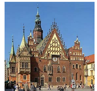
Wroclaw : Hôtel de Ville