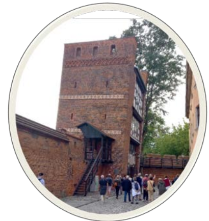
Tour penchée de Torun