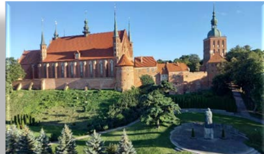
Cathédrale de Frombork

Mardi 6 : réveil matinal, car route au nord vers Olsztyn. Visite de la vieille ville, cathédrale Saint-Jacques et château du chapitre de Warmie. Continuation vers Frombork, la ville de Copernic, le fameux astronome, où nous avons pu voir dans la cathédrale, son tombeau retrouvé en 2008, grâce à l'ADN des cheveux de son oncle.