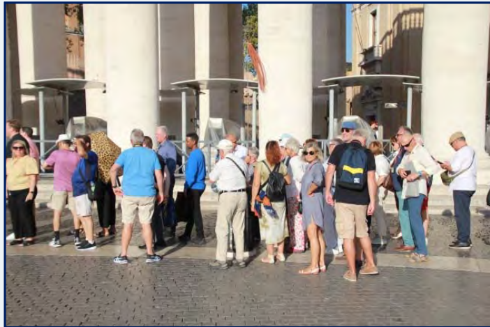
Dans la file d'attente, sur la place Saint-Pierre pour visiter la basilique

Le 11, nous passons toute la journée dans la Cité du Vatican, le matin dans le musée et la chapelle Sixtine, l'après-midi à visiter la basilique Saint-Pierre.