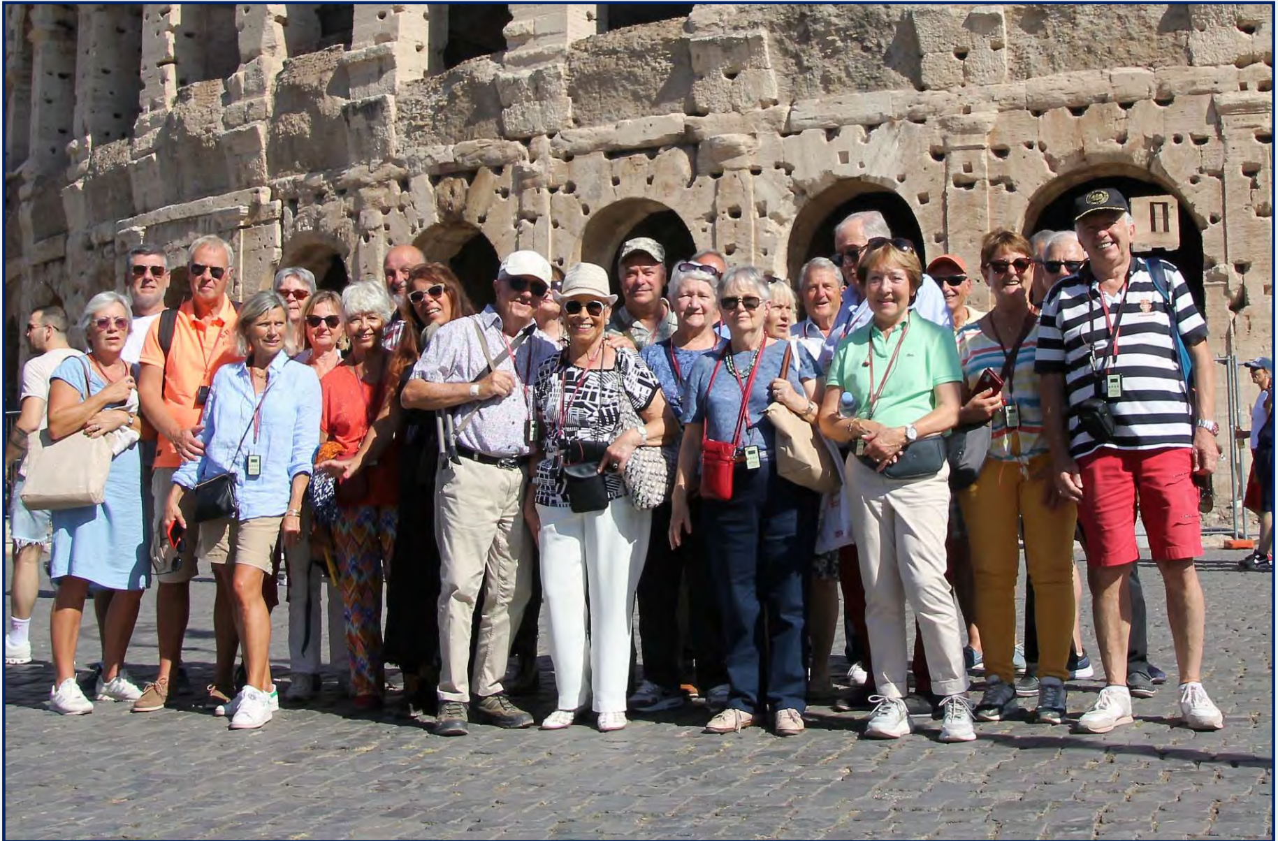
Le groupe devant le Colisée, le 12 octobre