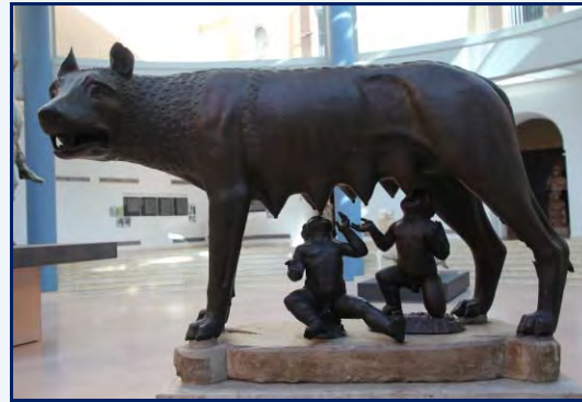
Le mythe fondateur de Rome, la louve allaitant Romulus et Remus