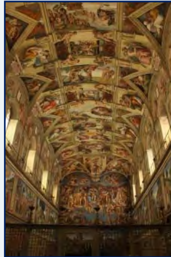
La chapelle Sixtine