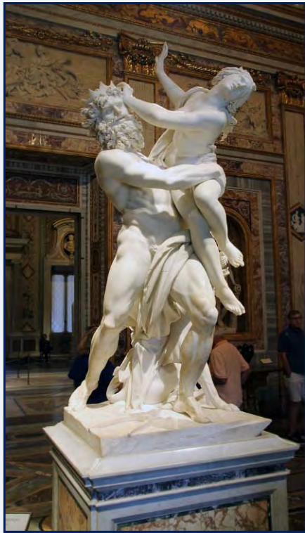
L'enlèvement de Proserpine de Gian Lorenzo Bernini

Le 13 octobre. Pour cette dernière journée, la matinée est consacrée à la visite de la perle des musées romains, la galerie Borghèse. Durant le court temps libre qui nous est laissé après le déjeuner, plusieurs se retrouvent piazza di Spagna avant de reprendre un car vers l'aéroport Léonardo da Vinci.