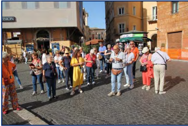
Visite de la piazza Navona