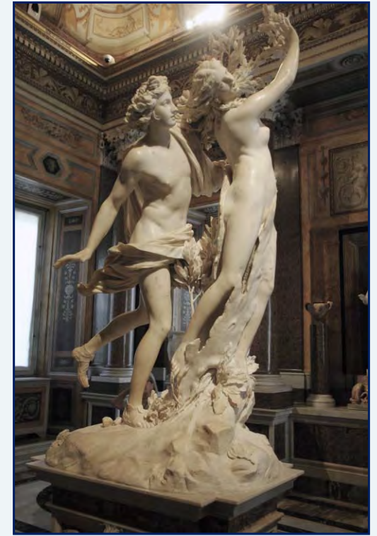
Apollon et Daphné de Bernini

Le 13 octobre. Pour cette dernière journée, la matinée est consacrée à la visite de la perle des musées romains, la galerie Borghèse. Durant le court temps libre qui nous est laissé après le déjeuner, plusieurs se retrouvent piazza di Spagna avant de reprendre un car vers l'aéroport Léonardo da Vinci.