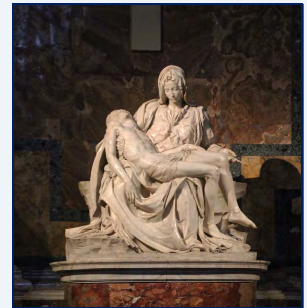
La Piéta de Michel-Ange

Le 11, nous passons toute la journée dans la Cité du Vatican, le matin dans le musée et la chapelle Sixtine, l'après-midi à visiter la basilique Saint-Pierre.