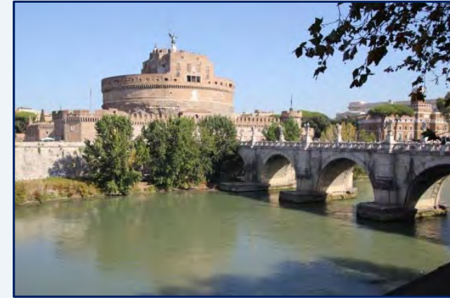
Le château Saint-Ange près du Vatican