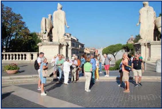
Prêts pour une nouvelle journée de découverte, devant le musée du Capitole