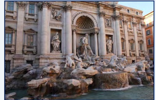
La fontaine de Trévi