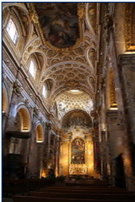
Saint-Louis des Français

10 octobre - Le groupe est réuni dans un restaurant en plein centre de Rome, à côté de l'hôtel pour un déjeuner en commun. Dans l'après-midi, visite de la piazza Navona, du Panthéon, de l'église Saint-Louis des Français et de la fontaine de Trévi.