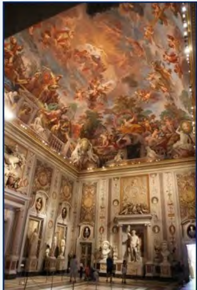
La galerie Borghèse