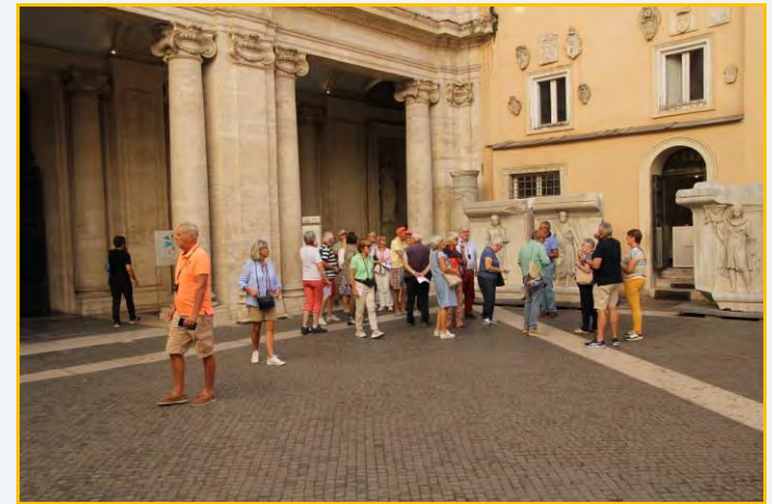
Dans la cour du musée du Capitole