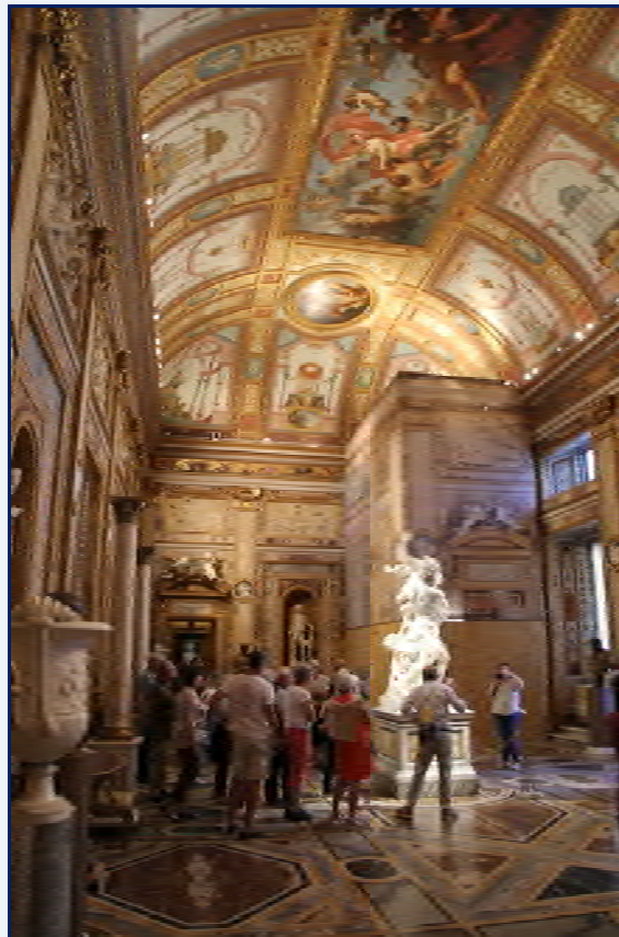
Le groupe dans la galerie Borghèse