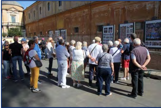
Explications, à l'extérieur, de ce que nous allons voir, à l'intérieur