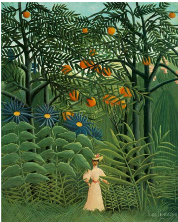
Le Douanier Rousseau

En imprimerie, le vert s'obtient par un mélange de bleu cyan et de jaune. On ne peut pas produire un vert à la fois très saturé et lumineux comme celui de tous nos écrans, en raison de l'imperfection des pigments cyan, qui absorbent du vert, mais la nécessité s'en fait assez peu sentir.